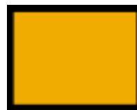
Tableaux des gabarits pour des véhicules du poids dangereux - réfléchissants