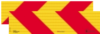
Tableaux des gabarits pour des véhicules lourds, horizontal ECE R 70.01