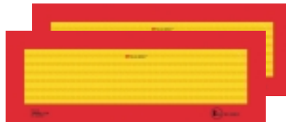
Tableaux des gabarits pour des véhicules longs, horizontal ECE R 70.01