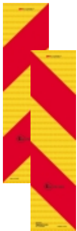
Tableaux des gabarits pour des véhicules lourds, vertical ECE R 70.01

TOUS LES VEHICULES DU GROUPE DE VÉHICULES LOURDS, LONG ET LENT AURAIT EXCLUSIVEMENT PREVUE PLAQUES DIMENSION HOMOLOGUEES AUX FINS DE LA NOTICEABILITY AUGMENTE EN CIRCULATION.