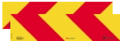
Tableaux des gabarits pour des véhicules lourds ECE R 70.00