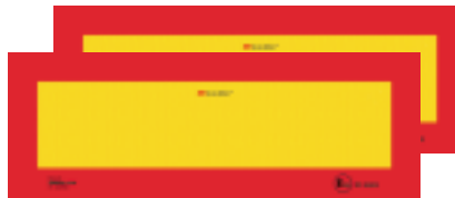
Tableaux des gabarits pour des véhicules longs ECE R 70.00