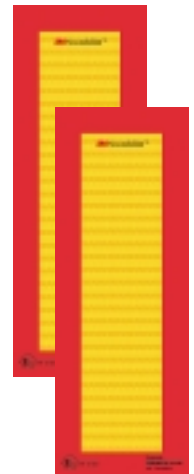
Tableaux des gabarits pour des véhicules longs, vertical ECE R 70.01