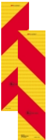
Tableaux des gabarits pour des véhicules lourds, vertical ECE R 70.01

TOUS LES VEHICULES DU GROUPE DE VÉHICULES LOURDS, LONG ET LENT AURAIT EXCLUSIVEMENT PREVUE PLAQUES DIMENSION HOMOLOGUEES AUX FINS DE LA NOTICEABILITY AUGMENTE EN CIRCULATION.