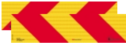
Abmessungsschild für schwere Fahrzeuge, horizontal ECE R 70.01