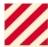
Warnschilder für verlängerte Ladungen - reflektierend