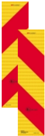
Abmessungsschild für schwere Fahrzeuge, vertikal ECE R 70.01

ALLE FAHRZEUGE AUS DER GRUPPE DER SCHWEREN, LANGEN UND LANGSAMEN FAHRZEUGE DÜRFEN NUR VORSCHRIFTSGEMÄSSE HOMOLOGIERTE BEGRENZUNGSSCHILDER HABEN, UM IM VERKEHR BESSER BEMERKBAR ZU SEIN.