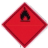
Warnschilder und Aufkleber für entflammare Ladungen - reflektierend