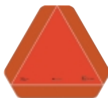
Abmessungsschild für langsam fortbewegende Fahrzeuge ECE R 69.00