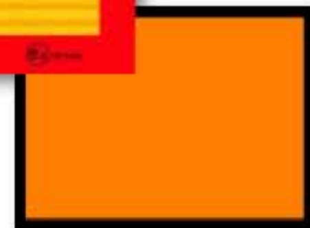
Ploča opasnog tereta