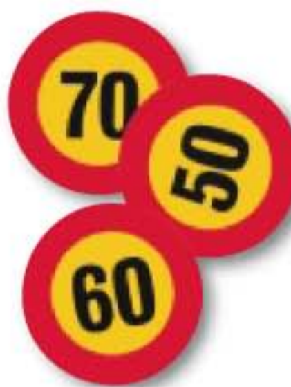
Naljepnice ograničenja brzine.

"Naljepnica HR" državna oznaka za vozila prema međunarodnim normama. Naljepnica ima broj atesta U-11378/00