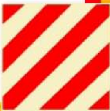
Ploča produženog tereta