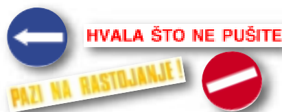
Aufkleber für Richtung, Verbot, danke das Sie nicht Rauchen und abstand halten sind nur ein teil des Angebots

Es ist wichtig zu bemerken das alle Produkte aus unserem Sortiment gemäß den Gesetz über den Verbraucherschutz deklariert und markiert sind (NN 96/03 von dem 10. Juni 2003., art. 17 i 18.)