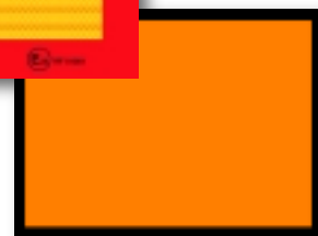
Kennzeichnungstafel für gefährliche Lasten