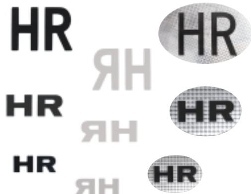
Ein HR Aufkleber für nationale Fahrzeuge gemäß den internationalen Standards