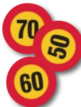
Aufkleber für geschwindigkeitsbegrenzungen